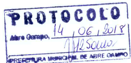
Márcio Moreira Vítor Prefeito Municipal